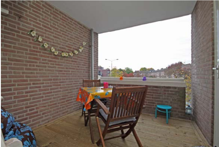
Balkon op zonzijde