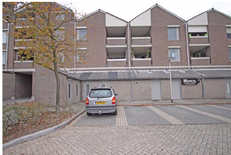
Parkeerplaats achter het appartement